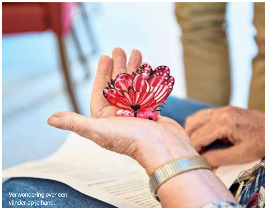
Verwondering over een vlinder op je hand.

De geestelijk verzorger vraagt dit omdat hij merkt dat we leven in een maatschappij waarin denken hooggewaardeerd wordt. “Mensen koppelen hun identiteit sterk aan het denken en aan wat je daarmee kunt. Maar dat betekent dat je, als je je denkver-